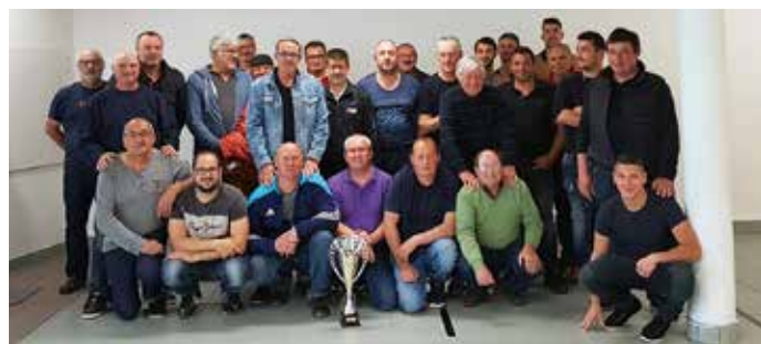
Participants à l'inter clochers 2019.

Pour tous renseignements, vous pouvez contacter Laurent CHÉNEAU (président) au 06-21-03-50-94