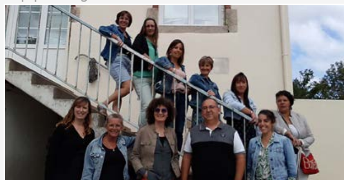
Équipe enseignante de l'école Louis Chaigne