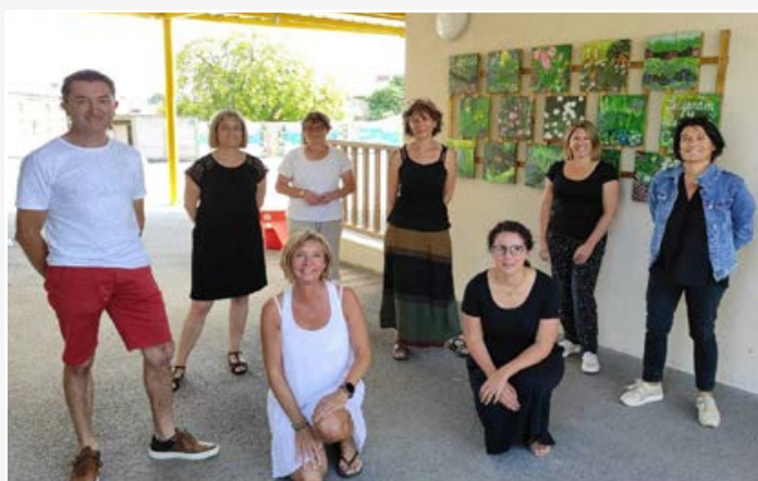
Équipe enseignante de l'école La Fontaine

Les agents en charge de la surveillance de la cour et du restaurant scolaire ont débuté une formation à la médiation entre pairs afin d'aider les élèves à mieux gérer leurs conflits sur le temps de pause méridienne ; formation qui complète celle effectuée par les enseignants.