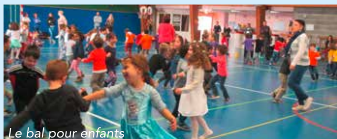
Le bal pour enfants