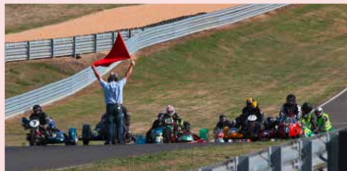
Départ imminent : circuit Haute Saintonge la Génétouze (Charentes Maritimes)

Nous avons également organisé notre deuxième rassemblement hivernal de side-cars et motos à Venansault les 14 et 15 janvier. Nos invités, venus des régions voisines, ont passé un agréable week-end ensoleillé réunis autour du feu de camp traditionnel.