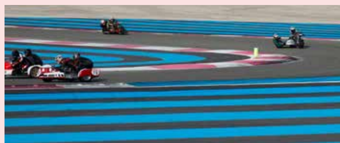
Gros freinage du raccordement : circuit Paul Ricard