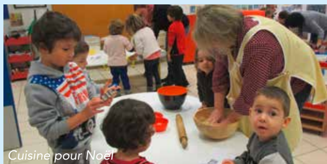
Cuisine pour Noël

La fin de l'année nous amène également à nous projeter vers la rentrée qui cette année se fera le lundi 4 septembre 2017.