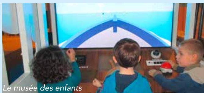
Le musée des enfants

L'année a été ponctuée de sorties : le port de Saint Gilles, le musée des enfants à l'Historial, l'aquarium de Talmont. Nous avons également fait venir un spectacle de marionnettes (Baleine croisière) et participé au bal pour enfant de Dompierre. Sans oublier les ateliers cuisine qui ponctuent les moments importants de la vie de l'école.