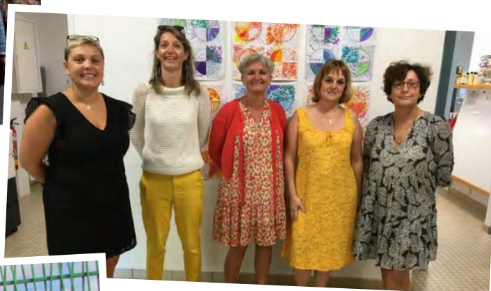
← Équipe enseignante de l'école publique élémentaire « La Fontaine »