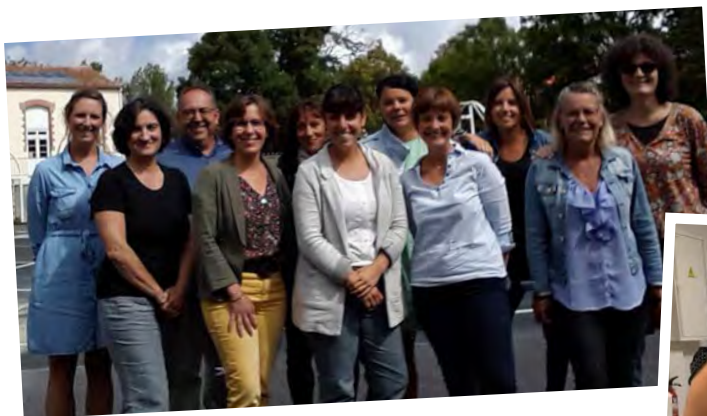
← Équipe enseignante de l'école privée « Louis Chaigne »