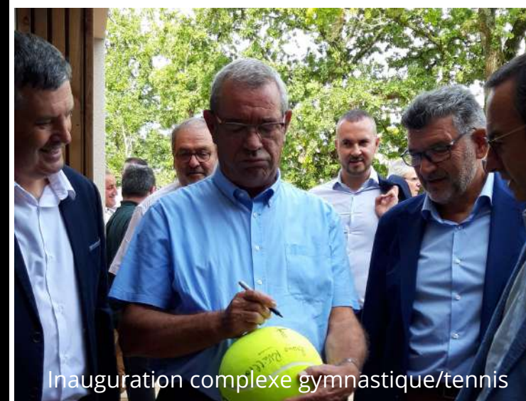
Inauguration complexe gymnastique/tennis