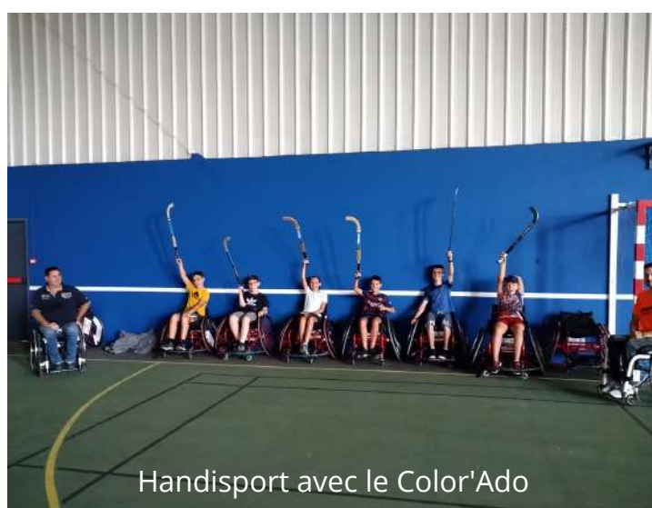
Handisport avec le Color'Ado