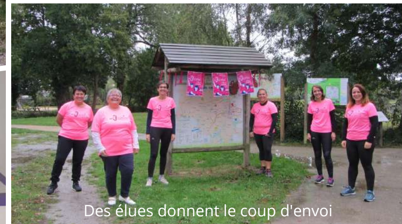
Des élues donnent le coup d'envoi