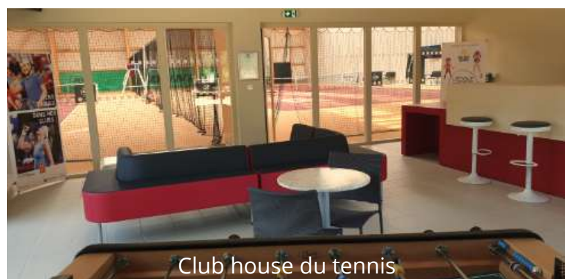
Club house du tennis