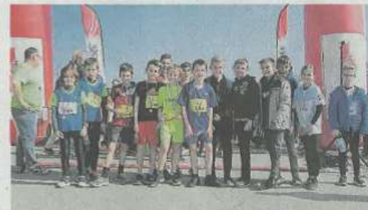
Les enfants ont pris le départ à 11 h 15. Ils étaient 45 à s'élancer pour le départ de la course d'une distance de 1 ou 2 kilomètres, au choix. Ils ont été récompensés à l'arrivée.