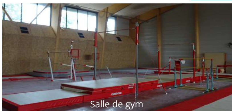
Salle de gym