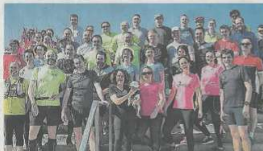
Cette course a mobilisé 169 bénévoles qui ont œuvré en amont, depuis plusieurs semaines. Ils étaient invités à inaugurer le parcours, samedi. Une cinquantaine d'entre eux ont pris le départ en avant-première !

Venansault — La première édition de la Venansaltaise a eu lieu dimanche. 169 bénévoles se sont mobilisés pour assurer l'encadrement des trois courses et des... 499 coureurs !